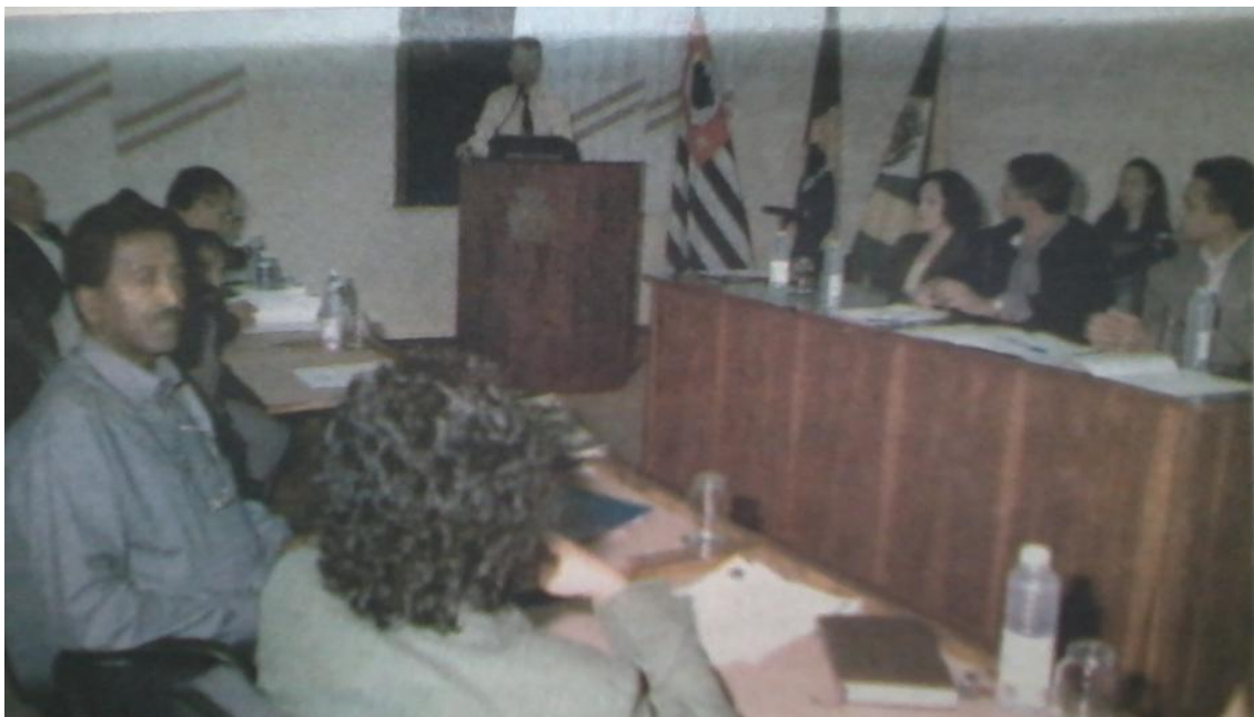
Vereadores em sessão ainda na sede velha da “Câmara Municipal”, no centro da cidade

esquina com a Rua Santa Bárbara, até a solução do impasse criado e a conclusão total das obras da nova sede.