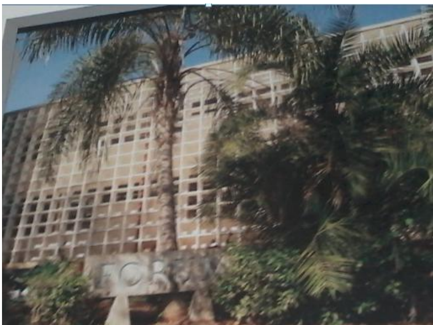
O “Palácio da Justiça” (o FORUM da cidade)