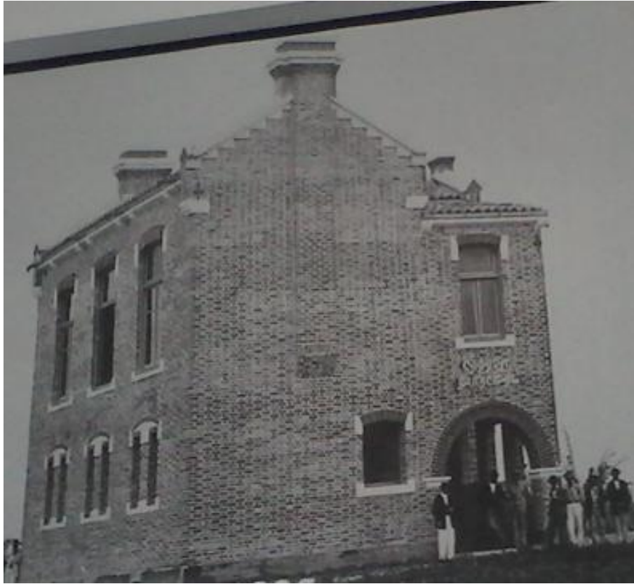
O prédio construído no “Largo São Sebastião”, no centro da cidade

Desafio vencido com a inauguração do edifício, construído com dois pavimentos no centro da cidade, para abrigar a “ Cadeia Pública ” (com funcionamento no pavimento inferior ) e a “ Câmara Municipal ” (com funcionamento no pavimento superior ), projetado pelo arquiteto francês Victor Dubugras , com arquitetura eclética, localizado no “ Largo São Sebastião ” (este prédio foi a segunda sede do Poder Legislativo e, no alto dele, a “ Câmara Municipal ” iria funcionar até o final de 1912).