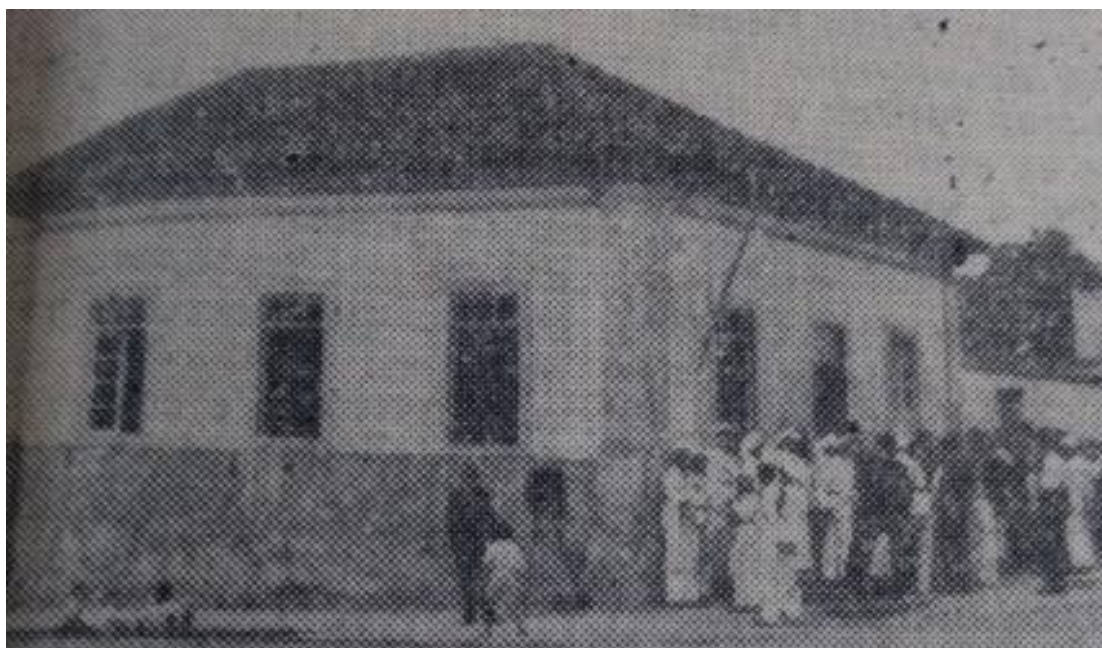
Eis a primeira sede da Câmara Municipal (junto à “Escola Municipal”)