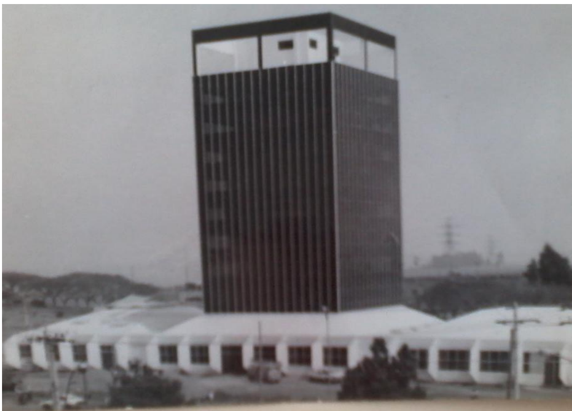
A nova sede da Prefeitura Municipal